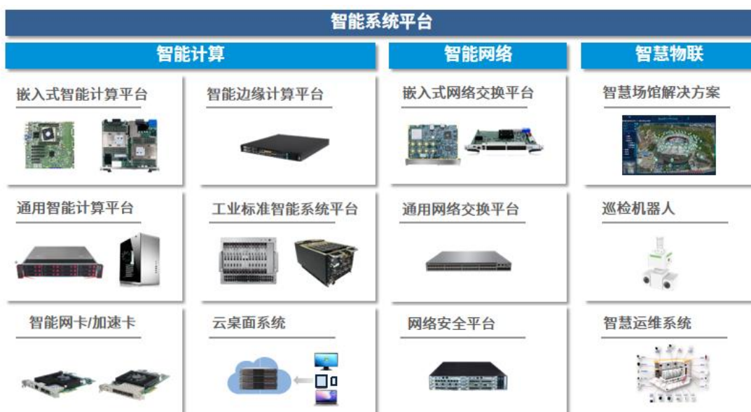
图 2：智能系统平台产品